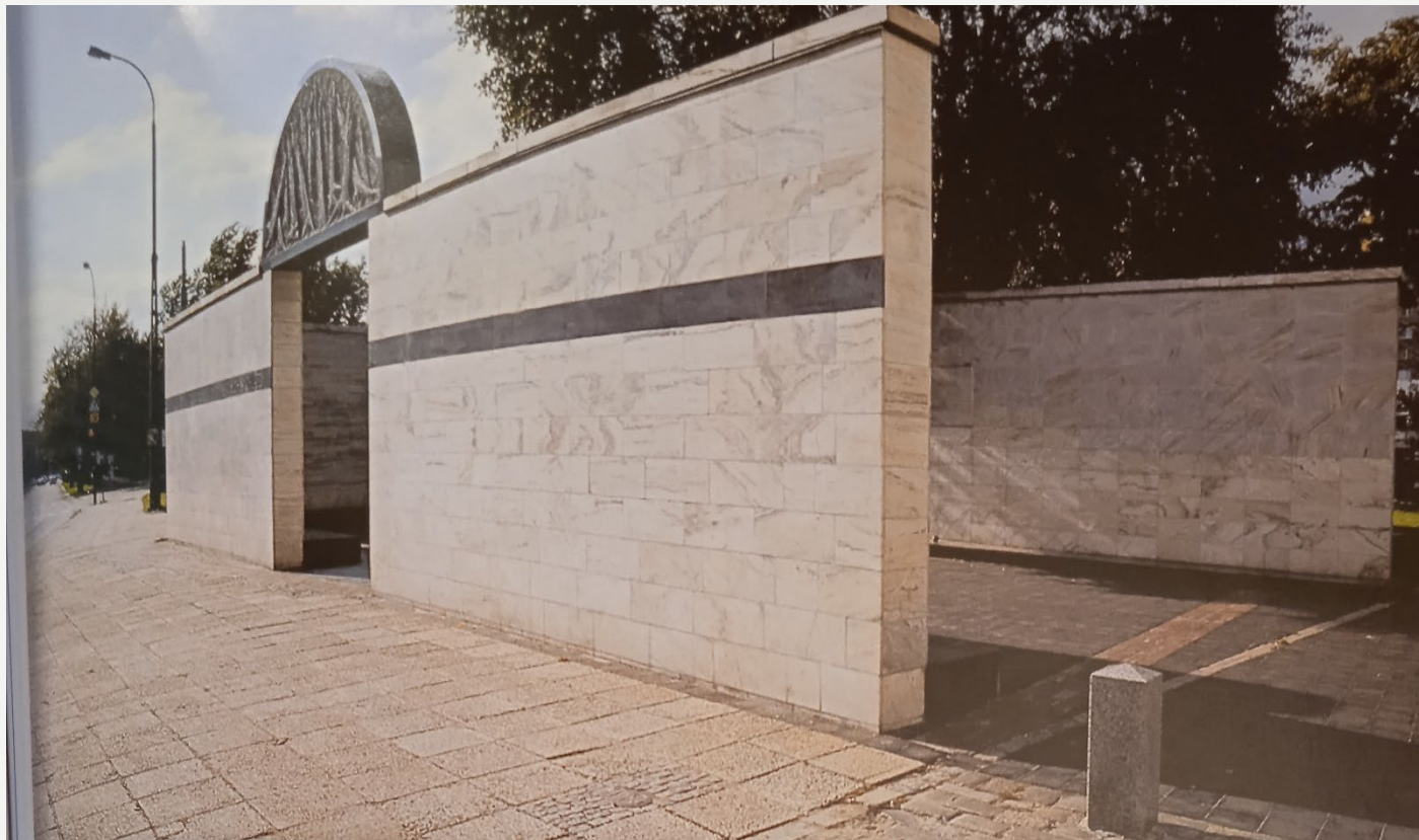
Pomnik Umschlagplatz na Trakcie Męczeństwa i Walki Żydów